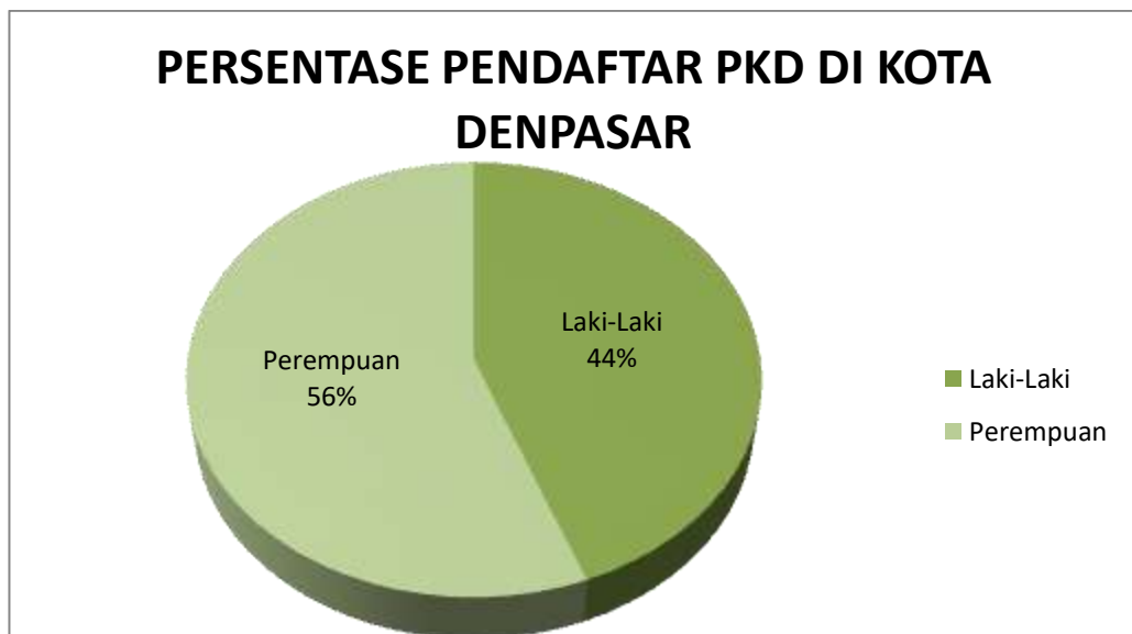
Grafik 4.2 Total Jumlah Pendaftar Panwaslu Kelurahan/Desa se-Kota Denpasar